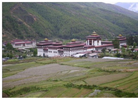
Tashichho (Thimphu) dzong