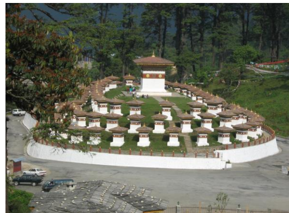
Dochula Pass & Dochula Chorten

I Punakha besöker ni landets viktigaste Dzong; det tidigare regeringsfästet i Bhutan, Punakha Dzong. Detta vackra fort har genom åren eldhärjats svårt, skadats i jordbävning och översvämmats av flodmassor.