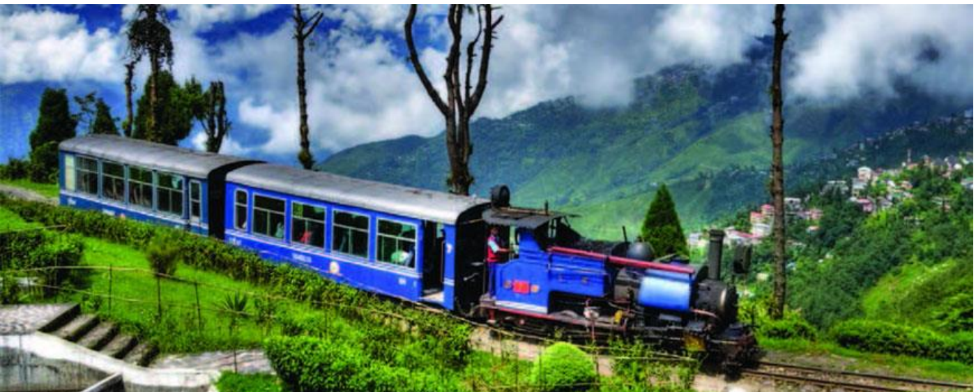
Darjeeling "toy train"

Darjeeling är belägen på 2.134 meters höjd och kallas för "de höga kullarnas juvel" eller "drottningen av alla kullar". Du befinner dig i ett av världens mest förnäma te-distrikt och här odlas "Teernas Champagne". Ni har idag en tidig frukost och transfer till tågstationen för en resa med det smalspåriga Darjeeling Himalayan Railway Co som ofta kallas "the toy train". En tågresan genom mycket vackert landskap från Darjeeling till Ghum t/r. Ni besöker idag även Darjeeling Rock Garden, Tea Plantations Darjeeling, Happy Valley tea estate. Övernattning på Swiss Hotel Darjeeling