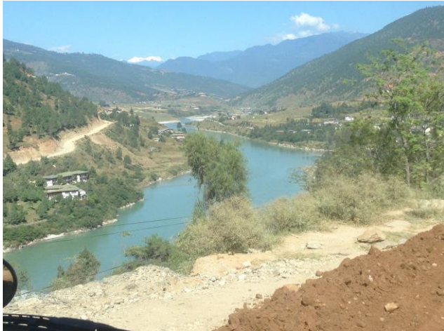
Resan i Bhutan präglas av vackra vyer...

Idag är Punakha Dzong restaurerat enligt ursprunget från 1600-talet. (av respekt för landets unika tradition och monarkin måste alla besökare vara klädda med täckta armar och ben). Av yttersta respekt klär sig bhutanesiska män här ofta i en "vit sjal" som de draperar utanpå sin traditionella dräkt. Ni stannar också till i Wangduephodrang där området är känt för sin tillverkning av bambuprodukter liksom stenarbeten. Övernattning på hotell i Punakha