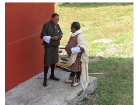
Traditionella dräkten "Gho"