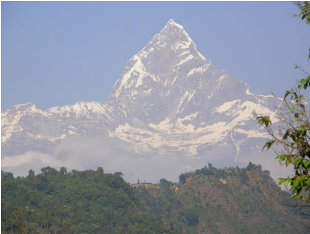
Det heliga berget "Fishtail", vy från Pokhara