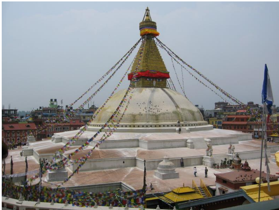
Bouddanath stupa, Kathmandu

Efter frukost flyger du till Kathmandu och blir där upphämtade med bil för transport till inbokat hotell.