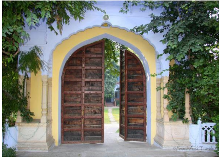
Entrén till Diggi Palace Jaipur