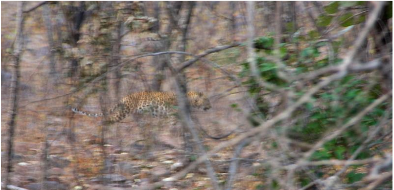
”Leopard fångad i flykten”

Rajasthan är en av Indiens mest fångslande och färgstarkaste delstater med inslag av turbaner, textilier och exotiska smycken. Här finns marmorslott, heta sanddyner, kameler och legender som för besökarens tankar tillbaka till svunna tider. Delstaten kan beskrivas som ett land med kungliga palats där prinsar och prinsessor har badat i juveler. Men här finns även elefanter, leoparder, tigrar, påfåglar och mängder av vänligt sinnade människor.