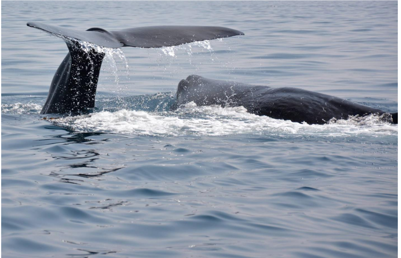
Marinsafari i Trincomalee