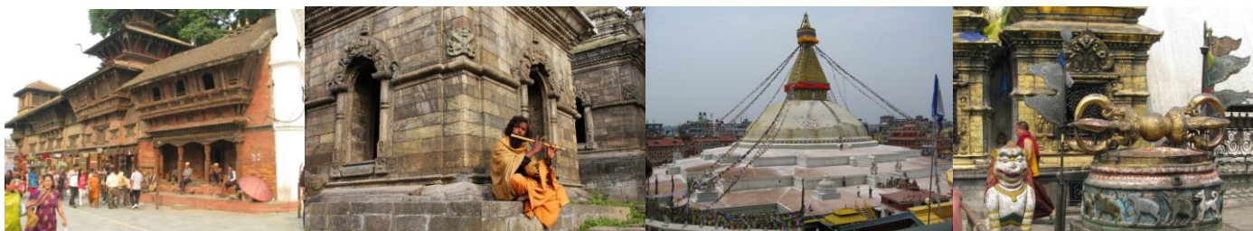
Sightseeing till flertalet UNESCO världsarv i Kathmandu

Innan vi lämnar Kathmandu besöker vi på morgonen Pashupatinath , hinduernas heliga tempelområde och begravningsplats. På platser kan mäta sig i de upplevelser och den mystik vi konfronteras med på denna heliga plats. Här intill floden sker öppet kremeringar av avlidna under dygnets alla ljusa timmar där sörjande familjer, närgångna apor och åskådare samlas. I Nepal är döden och ålderdomen lika naturligt och självklart som livet själv! Tempelplatsen som kan dateras till år 879 f.Kr är sedan 1979 ett UNESCO världsarv. Vi besöker även Boudhanath stupa, den viktigaste plats för tibetaner (buddhister) i hela Nepal.