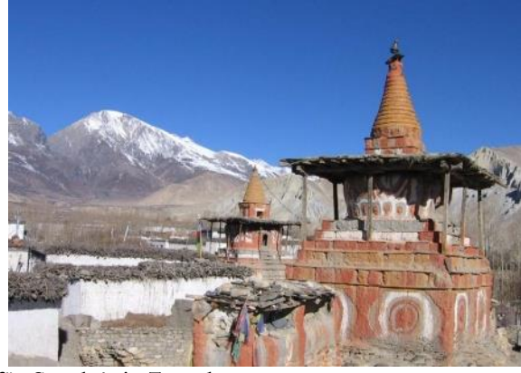
Bilder Mustang