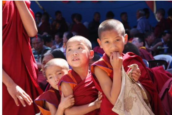
Mustang foto, Swed-Asia Travels

Mustang - ”det förbjudna landet” på den tibetanska högplatån som under 400 år var ett självständigt kungarike införlivades med Nepal under slutet av 1700-talet, fungerade som ett kungadöme fram till 2008. Till följd av dess isolerade läge och restriktioner mot besökare har områdets tibetanska kultur och traditioner bevarats väl. Så sent som 1992 öppnades Mustang för utländska besökare och fortfarande krävs specialtillstånd och lokala guider för besökare.