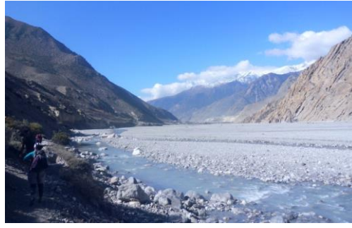
Kali Gandaki River