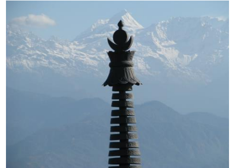
Utsikt över Himalayamassivet sett från Nagarkot